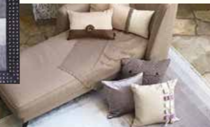
バナナシルク BR/GR W160×H230 160,000円(税別)