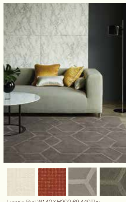
Luxury Rug W140×H200 69,440円~