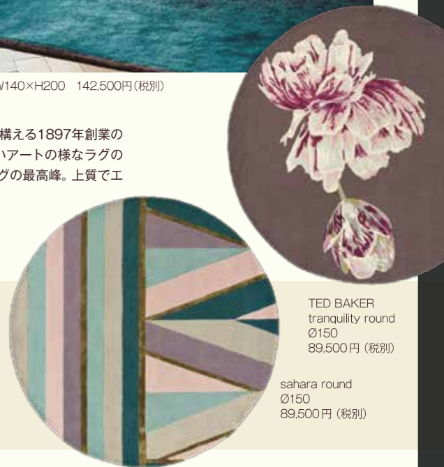
TED BAKER tranquility round Ø150 89,500円(税別)

絨毯をインテリアのメインにして思い切り楽しんでみませんか？ 今、世界最旬の絨毯は敷物という枠を超え、床いっぱいに大きなアートを描くように楽しむことがトレンド。今回、ミュージアム厳選の国内外5社から他では見られない美しい絨毯を豊富に取り揃えました。エレガントなデザインと肌触り、込められたストーリーなどその魅力は尽きません。最高峰の絨毯が一堂に見られる貴重なこの機会をお見逃しなく。コーディネーターが、あなたを魅力的な絨毯の世界に誘います。