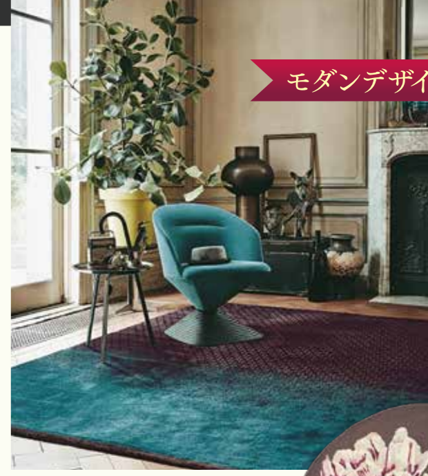
dipgeo W140×H200 142,500円(税別)